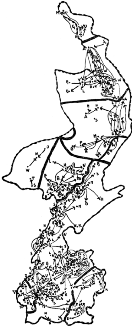
Kaart 3. Oordeel van respondenten over de dialectgelijkenissen in Limburg in 1939.

De onderzoeksmethode van Willems werd zo'n 50 jaar later, in 1939, weer opgepakt door dialectoloog Weijnen. 49 Hij vroeg respondenten in Limburg welke dialecten in hun omgeving op het hunne leken (kaart 2). Net als kaart 2 toont kaart 3 clusters van plaatsen rondom de woonplaats van de ondervraagden waar die