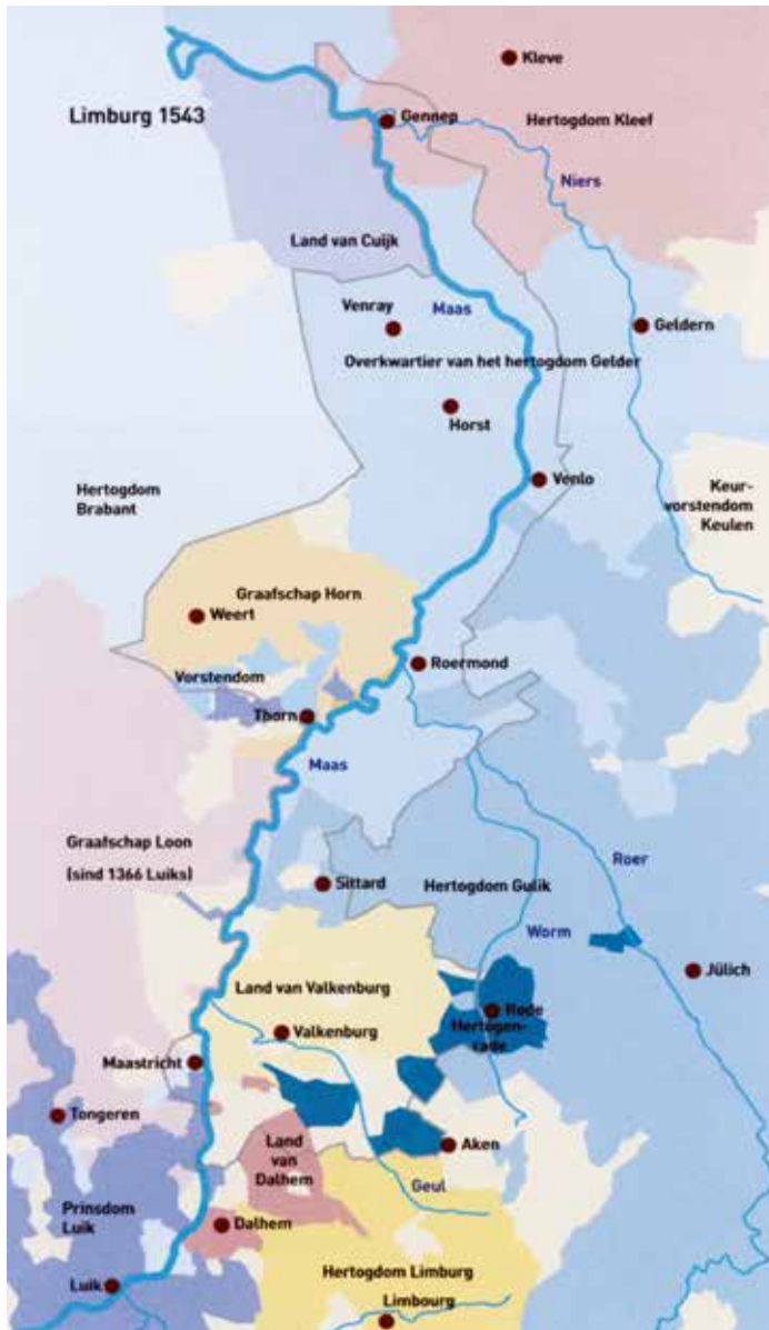
Kaart 1. De Staatkundige indeling van de Limburgse territoria omstreeks 1543.

Limburg, maar er was nauwelijks territoriale overlap met de huidige provincies Limburg in België en Nederland. Het lag tussen Verviers en Aken, ten zuiden van het huidige Nederlands-Limburg.