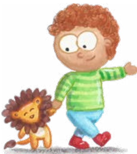
Illustratie: Studio Toussaint

De activiteiten sluiten aan bij artikel 7, lid 1f en 1g uit Deel II van het handvest.